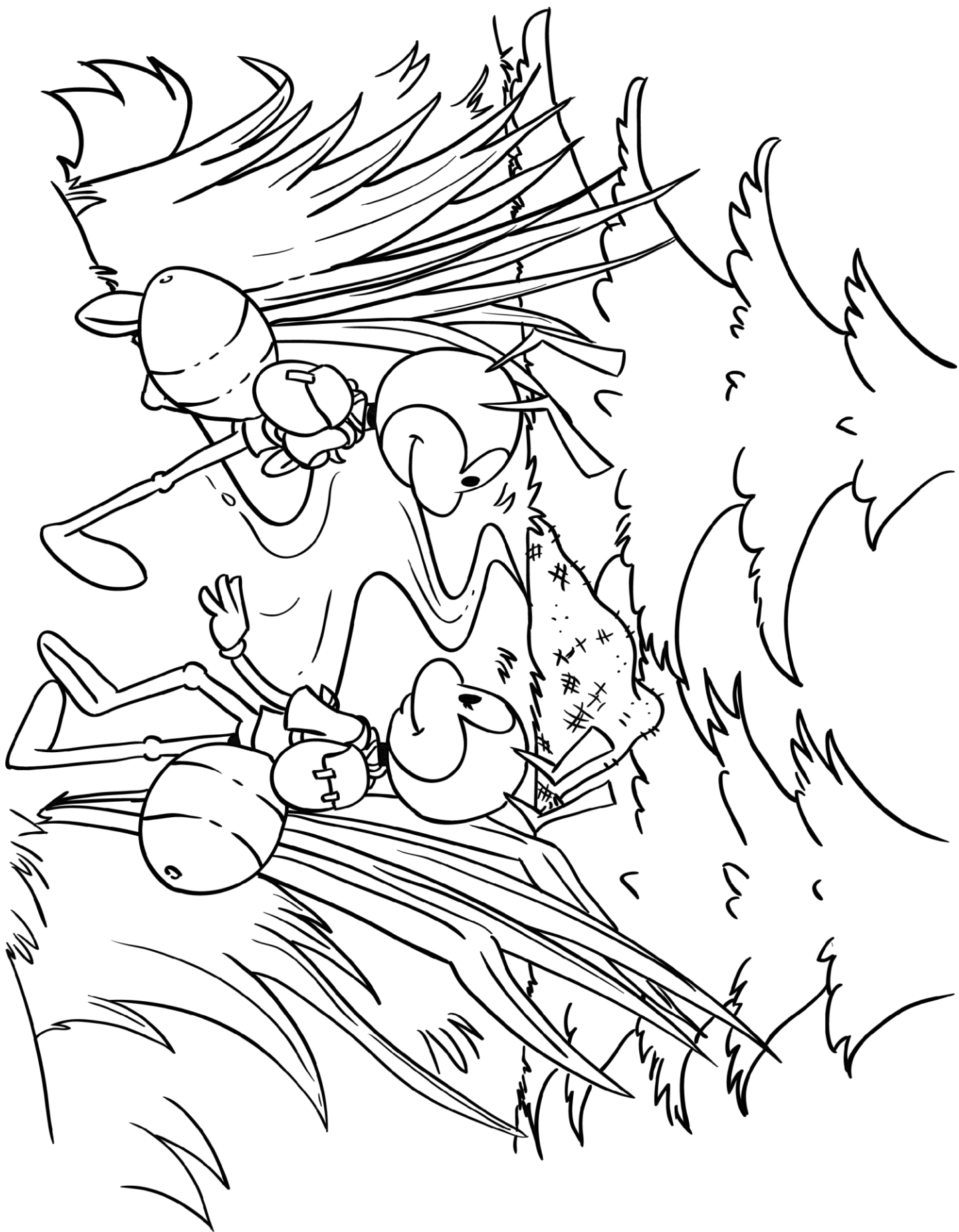
»Skavtski mravljici Franja in Tine«